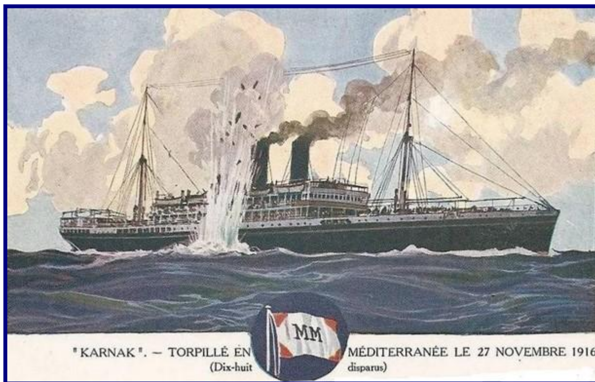
« KARNAK » - Torpillé en Méditerranée le 27 novembre 1916. (Dix-huit disparus)