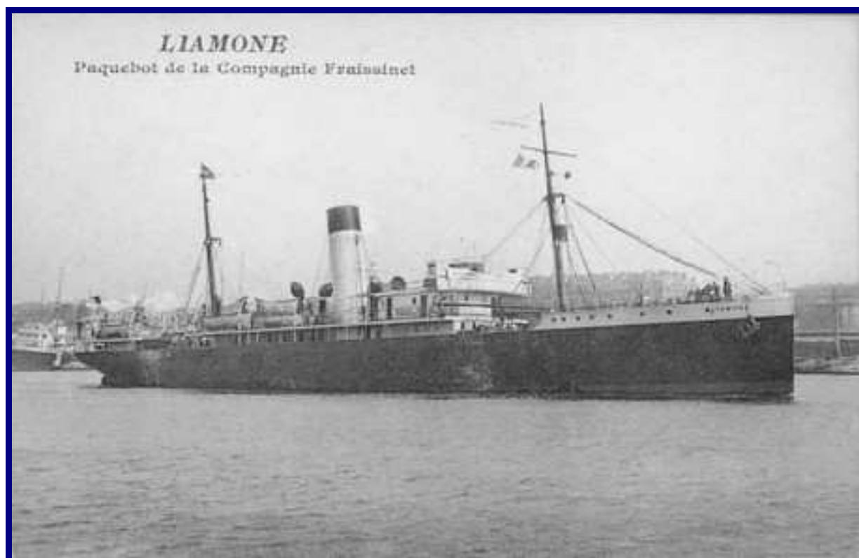
LIAMONE Paquebot de la Compagnie Fraissinet.