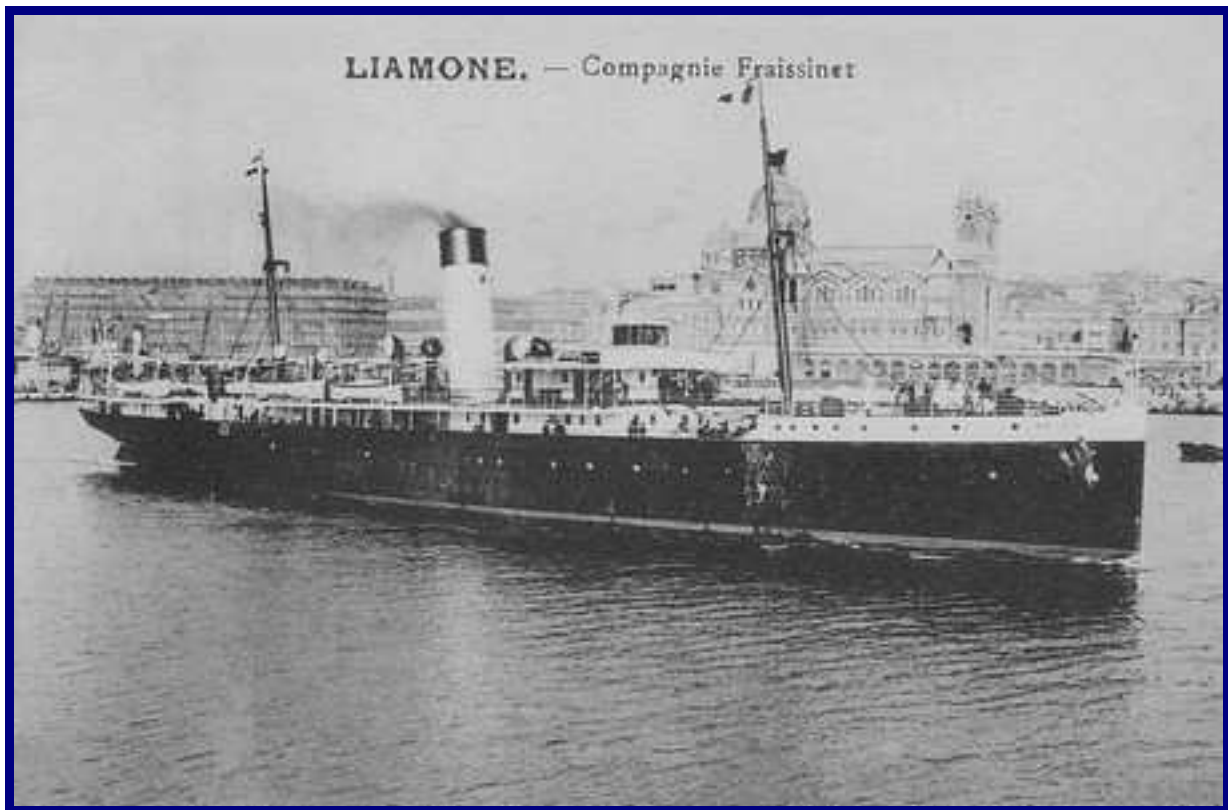
LIAMONE – Compagnie Fraissinet.