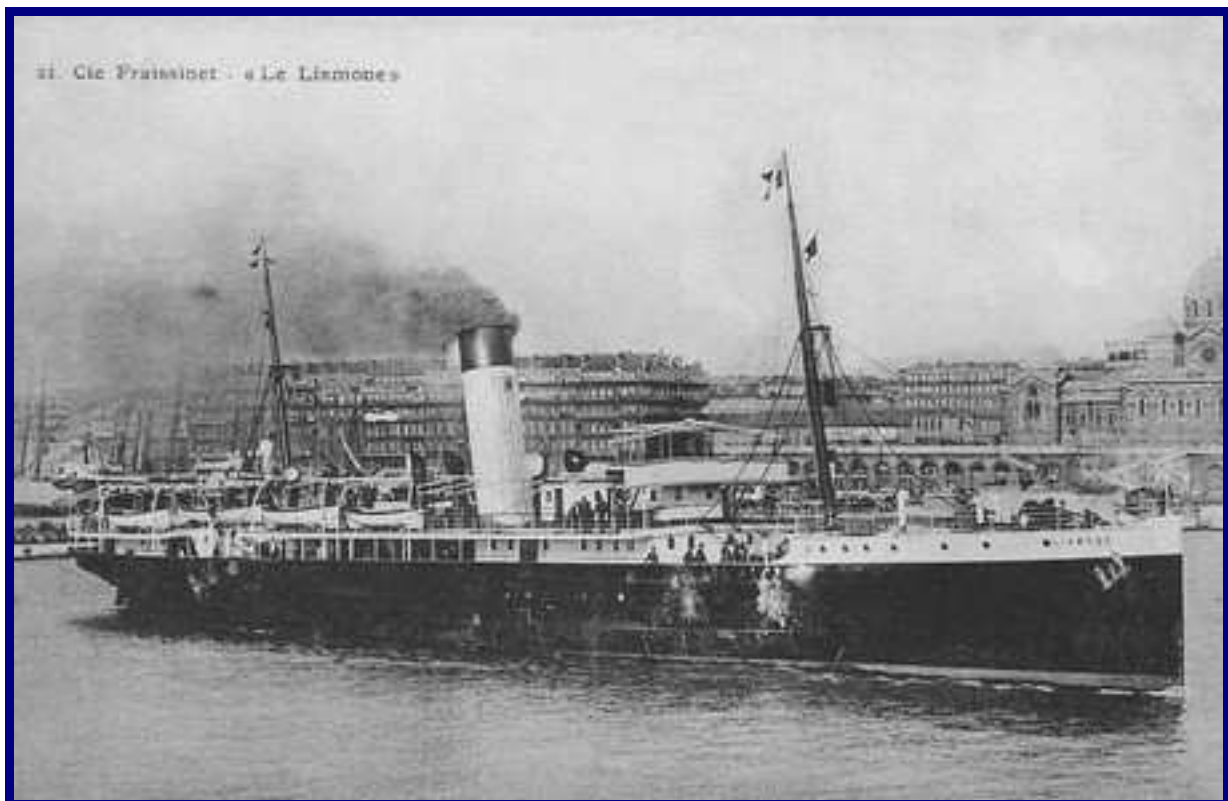
Cie Fraissinet – « Le Liamone ».