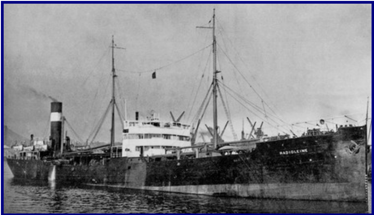
RADIOLEINE (2) Collection Bernard Bernadac © – La Compagnie de Navigation Mixte.