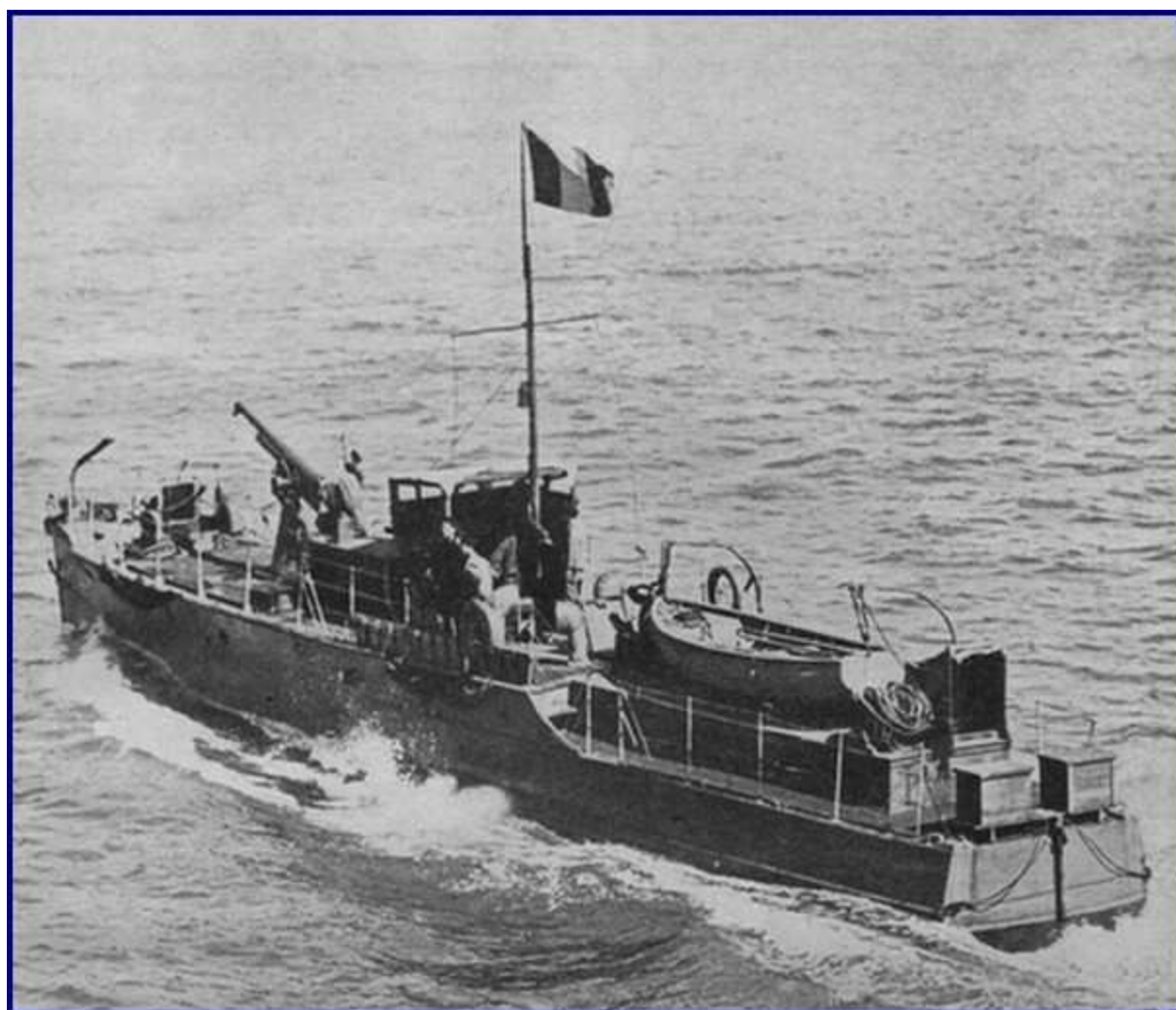
Vedette Canadienne (type ML) armée d'un canon de 75 Navire non numéroté

Les V69 et V71 rejoignent par la suite la Flottille du Rhin.