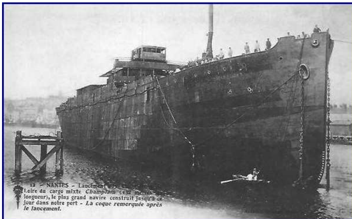
Nantes – La coque remorquée après le lancement.