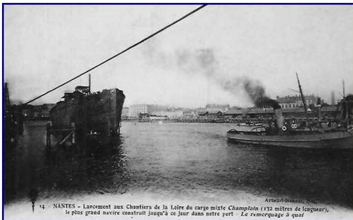
Nantes – Le remorquage à quai.